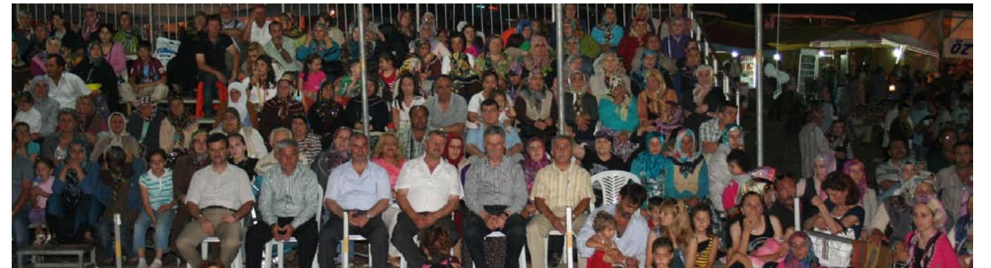
Başkanımız Mehmet ELLİBEŞ'in konuşmaları