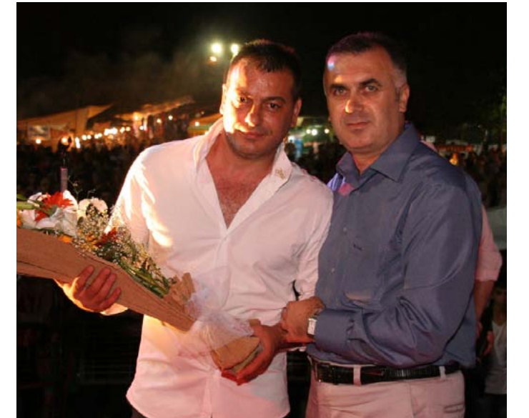
Ünlü sanatçı Recebim çiçek alırken