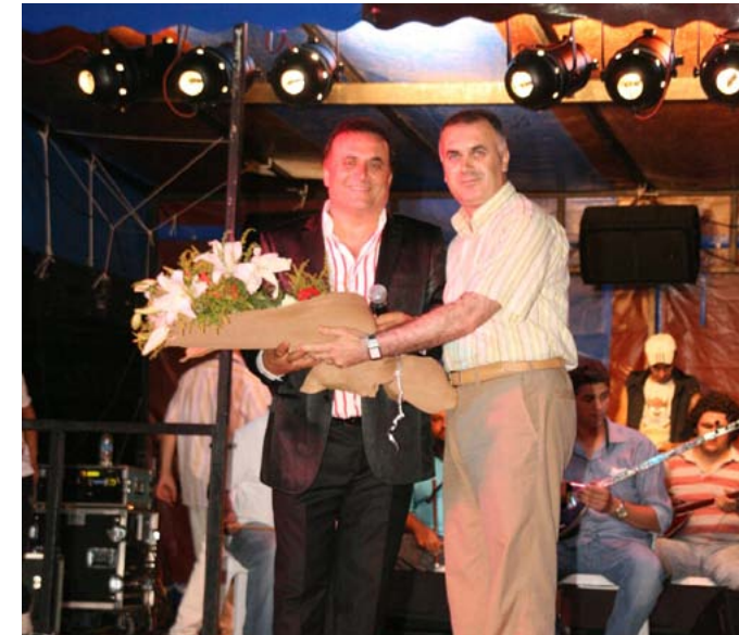
Sanatçı Taner EYÜPOĞLU çiçek alırken